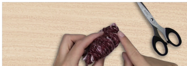
הצגת הלולאות, לפני חלק 3