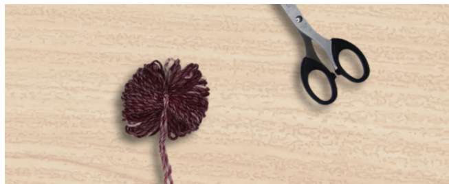
סיום חלק 2 - קשירת קשר כפול במרכז החוט המלופף