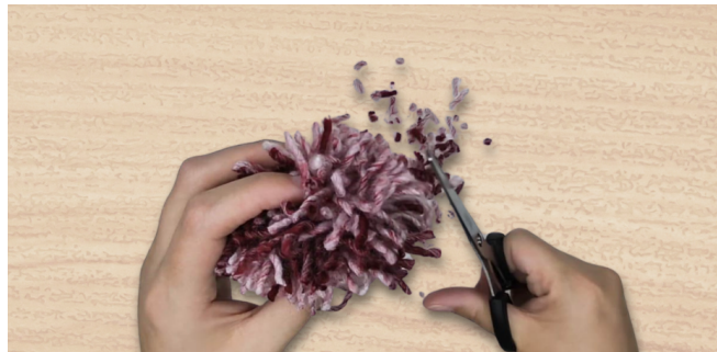
גזירה וסידור הפומפון לגודל הרצוי

זהו, הפומפון שלנו מוכן! סריגה מהנה וחורף נעים.